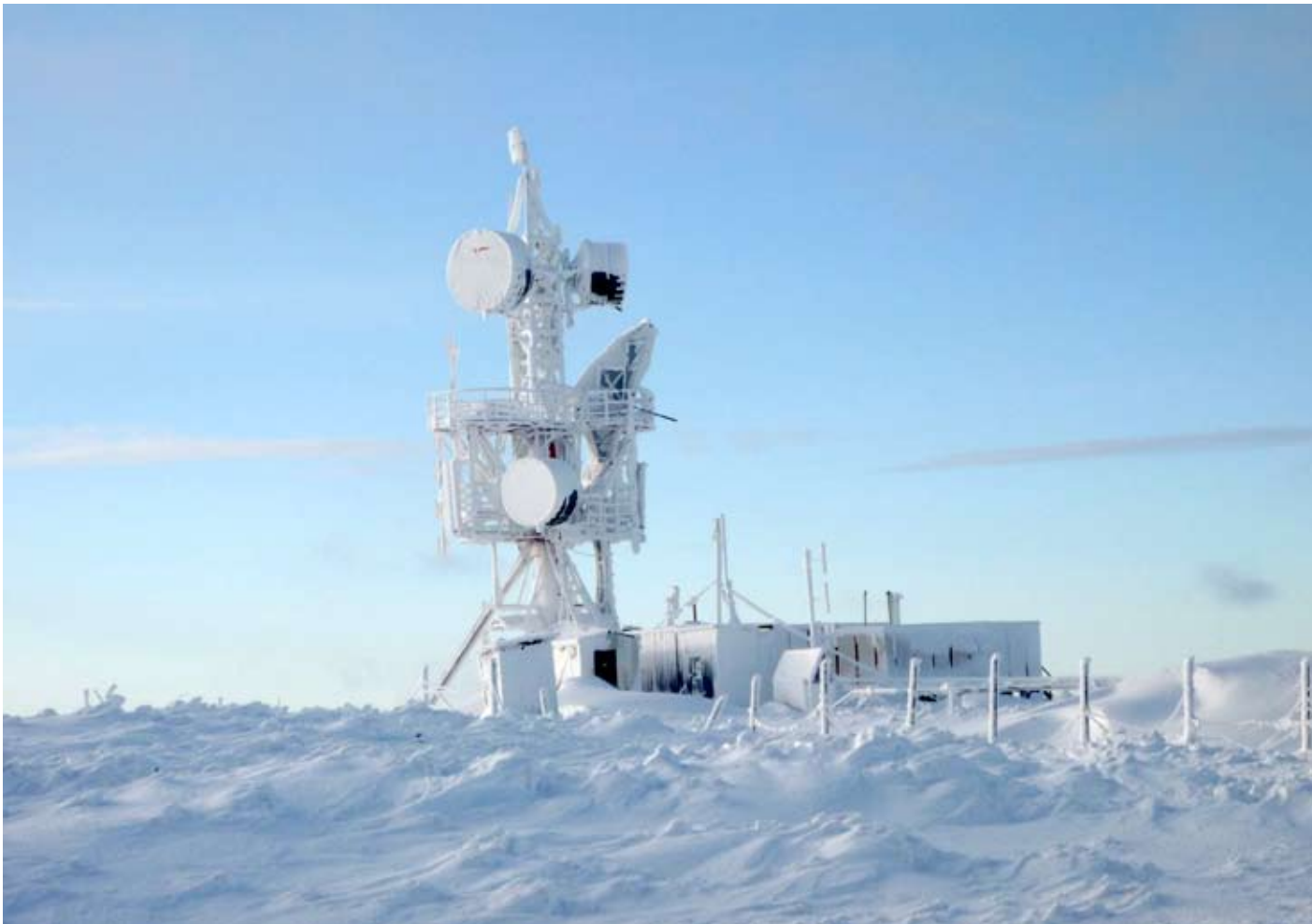
Узловая радиорелейная станция

Сегодня все регионы России инвестируют немалые средства в развитие телекоммуникационных сетей. На протяжении уже десяти лет ООО «АРД Сатком Сервис» реализует проекты в этой сфере. Успех компании обеспечивается благодаря современному оборудованию, поставляемому из-за рубежа, собственным разработкам и многолетнему партнерству с ведущими операторами телекоммуникационных услуг.